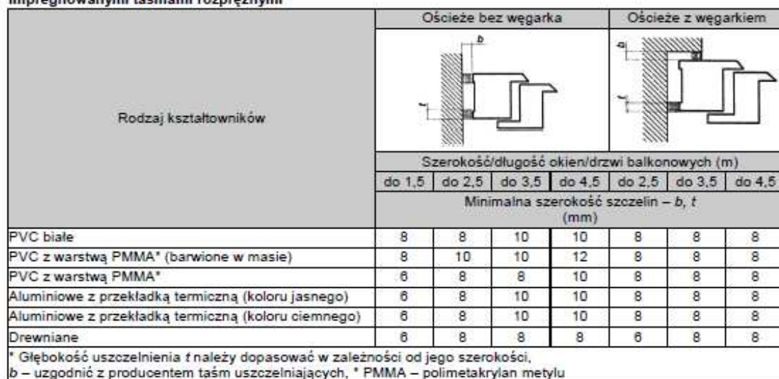
Tablica 4. Minimalna szerokość szczelin między ramą ościeżnicy a ościeżem przy uszczelnieniach impregnowanymi taśmami rozprężnymi*

Maksymalny wymiar szczeliny między ościeżnicą okienną a ościeżem nie powinien przekraczać 40 mm. Przy stosowaniu pianek jednoskładnikowych wymiar ten powinien wynosić maksymalnie 30 mm.